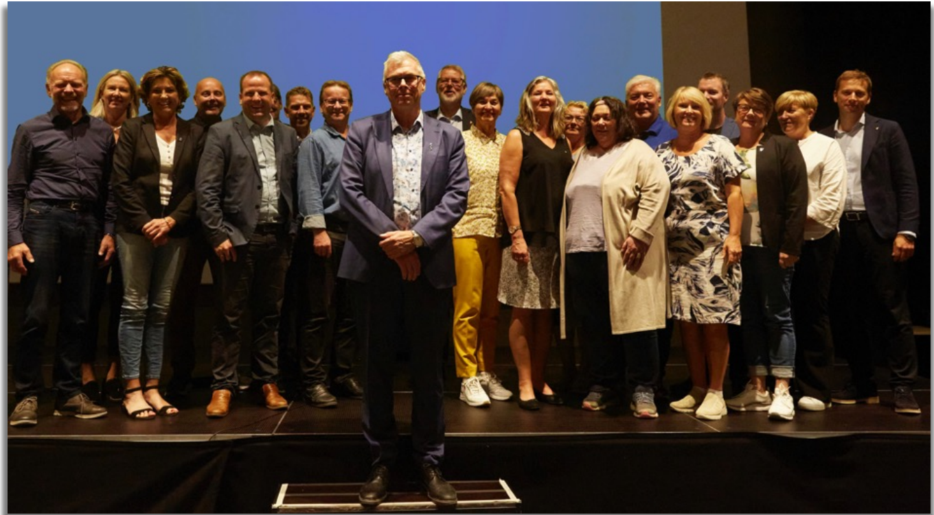
Landsstyret 2023 – 20 representanter fra 10 regioner