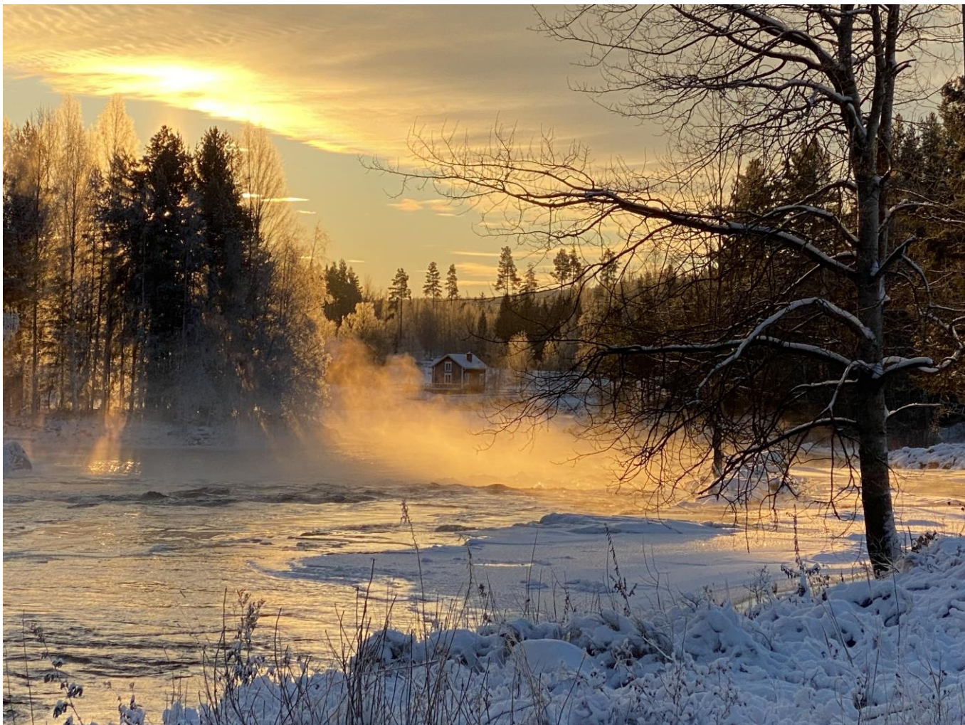
Voxnan Sörängsforsen, Bollnäs