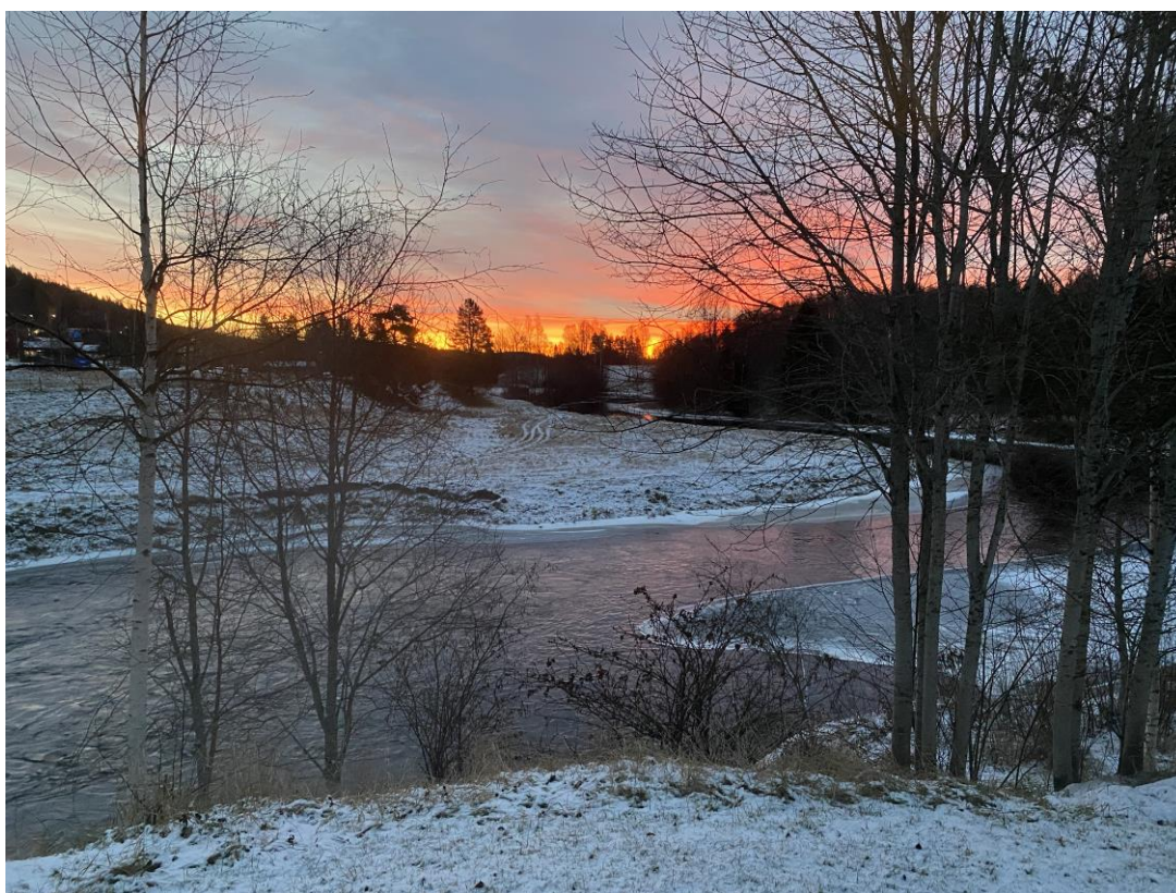
Svågan, Ångebo i Hudiksvalls kommun

Nu är det närmast dags att hålla stämmodagarna i en alldeles nybliven medlemskommun, Hudiksvall. Några större ärenden, liknande frågan om verksamhetsutvidgningen, för stämman att ta ställning till har hittills inte aktualiserats varför årets stämma torde bli av mera traditionell art.