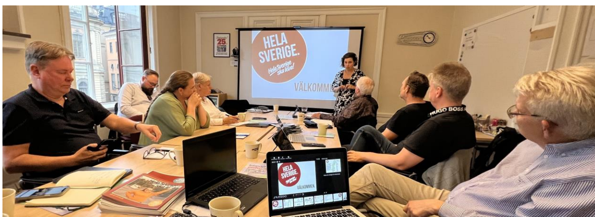
FSVs styrelsemöte i Hela Sverige Ska Levas lokaler i augusti 2023

När detta skrivs i april 2024 har fortfarande inget läckt ut om vad som händer med betänkandet. Kommer regeringen med en proposition eller vad blir fortsättningen i ärendet? Försök har gjorts att få någon från Miljöprövningsenheten inom Klimat- och näringslivsdepartementet som har utredningen på sitt bord att komma till föreningens stämmodagar i maj, men hittills har inget besked getts annat än att vi ska få ett svar.