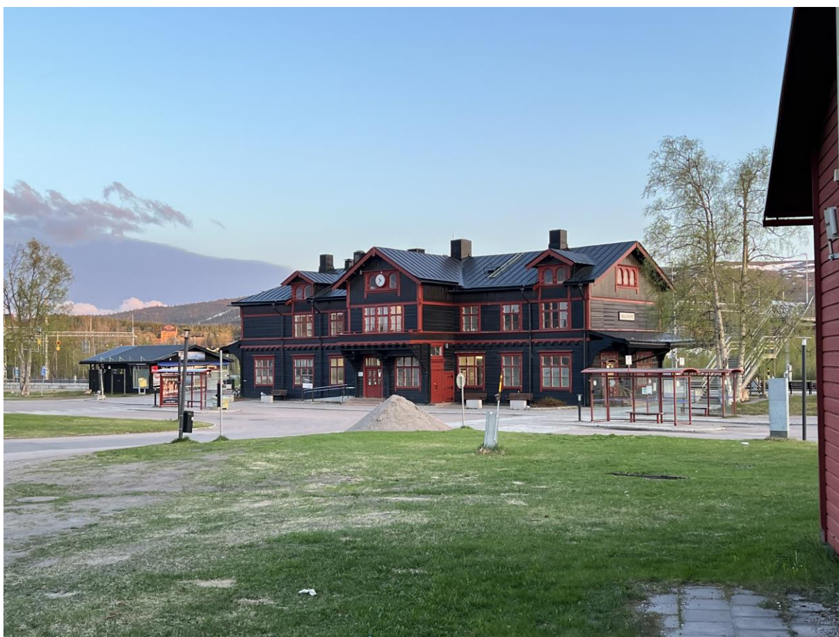
Gällivare järnvägsstation med Dundret i bakgrunden